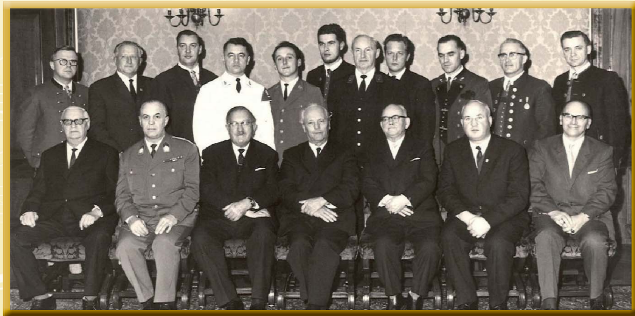
Gruppenfoto mit den Kapellmeistern aller geehrten Musikvereine 1966

1. Ehrung im Jahr 1966 - insgesamt 11 oberösterreichische Musikkapellen wurden für damals 3 erfolgreiche Teilnahmen bei Konzert- und Marschwertungen erstmals vom Land OÖ durch den Landeshauptmann geehrt.