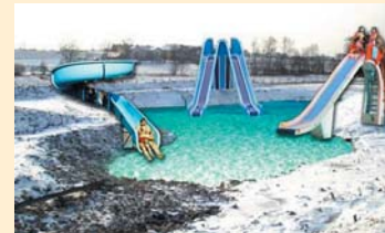
Das neue Aqua- Löppi