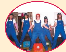
Unsere tschechischen Tänzerinnen