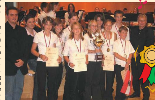
Neukirchner Jungmusiker - Olympia-Sieger

Die Neukirchner Jungmusiker sind wiederum „Olympia-Sieger“ – HERZLICHE GRATULATION! Bereits zum zweiten Mal trugen unsere jungen MusikerInnen beim alljährlichen Musik-Camp am Ritzhof beim olympischen Spielewettkampf den Sieg davon. Eine tolle Leistung – und klingt auch gut ➔ Doppel-Olympia-Sieger!