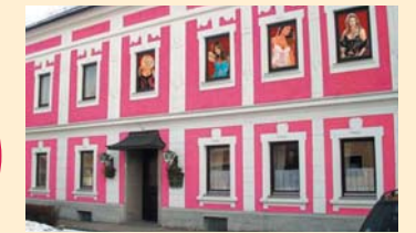
Die neue "Villa Pöll"