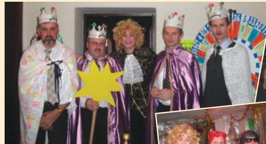
Bürgermeister & Gemeinderäte als „Hl. Drei Könige“ mit Gottschalk bei der Saalwette