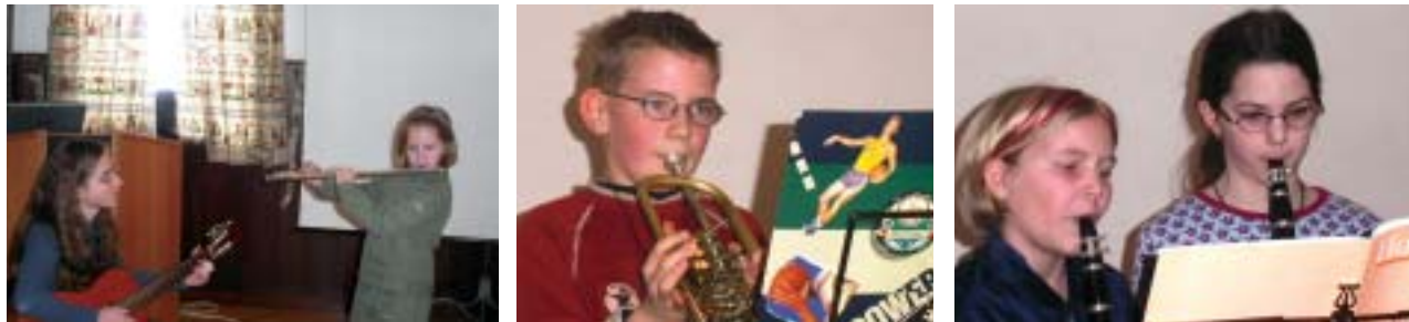
Unsere Nachwuchsmusiker bei Ihrem großen Auftritt bei der Jahreshauptversammlung

Höhepunkte des letzten Jahres waren sicherlich die Fernseh-Dreharbeiten für das Österreich-Bild „Land der Bläser“ samt ORF-Vorpremiere in Neukirchen bzw. neben den beiden Konzerten die Frühschoppen in Neukirchen, Buchkirchen und Offenhausen.