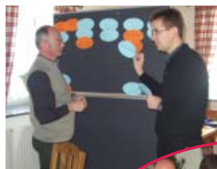
Seminargemäß wurden Ideen gemeinsam erarbeitet

Ziel war es, auf Basis der Ergebnisse der „Musiker-Fragebögen“ eine grobe Planung für die nächsten fünf Jahre zu erarbeiten.