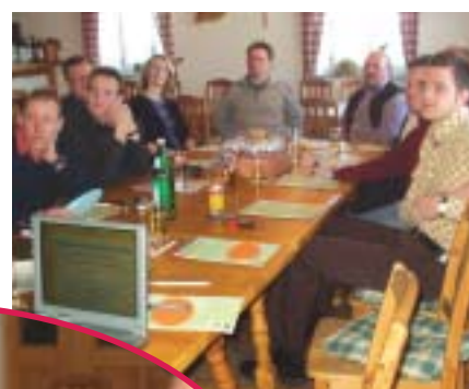
Der Musikvorstand in konzentrierter Diskussion

Die Ergebnisse der Klausur waren sehr positiv, einige bereits angeführte Ideen, wie die „Jugendkapelle“ oder unser aktives Werben nach unterstützenden Mitgliedern, sind dort entstanden.