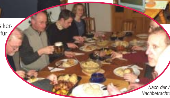
Nach der Arbeit gab's dann eine „gastronomische Nachbetrachtung“ bei Bratl & Most.

Weiters wurde bereits ein Grobkonzept für das Bezirksmusikfest im Jahr 2005 erarbeitet und die weitere Entwicklung unseres Vereines geplant.